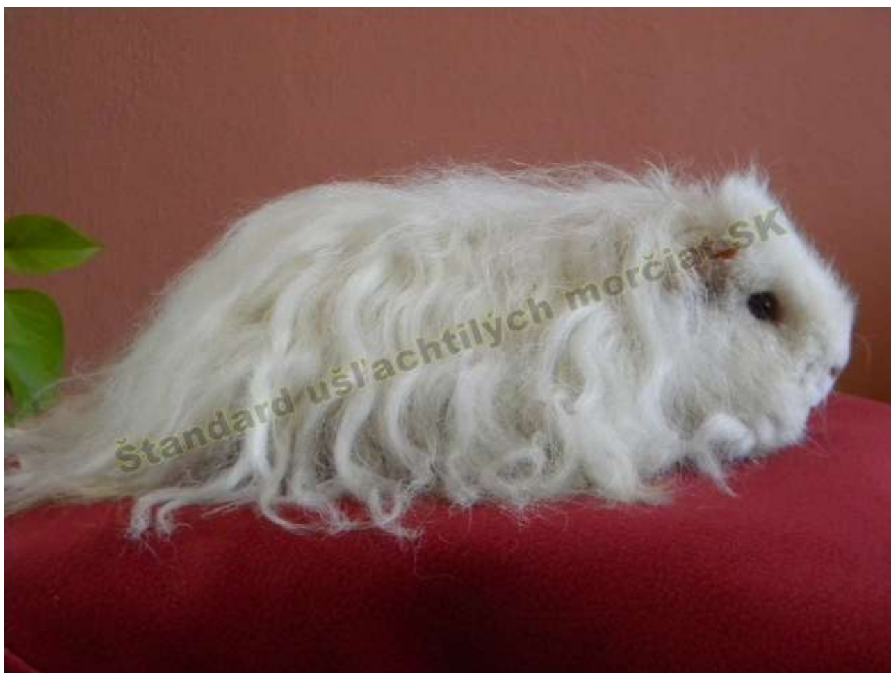
OBR. 4 BIELA TMAVOOKÁ