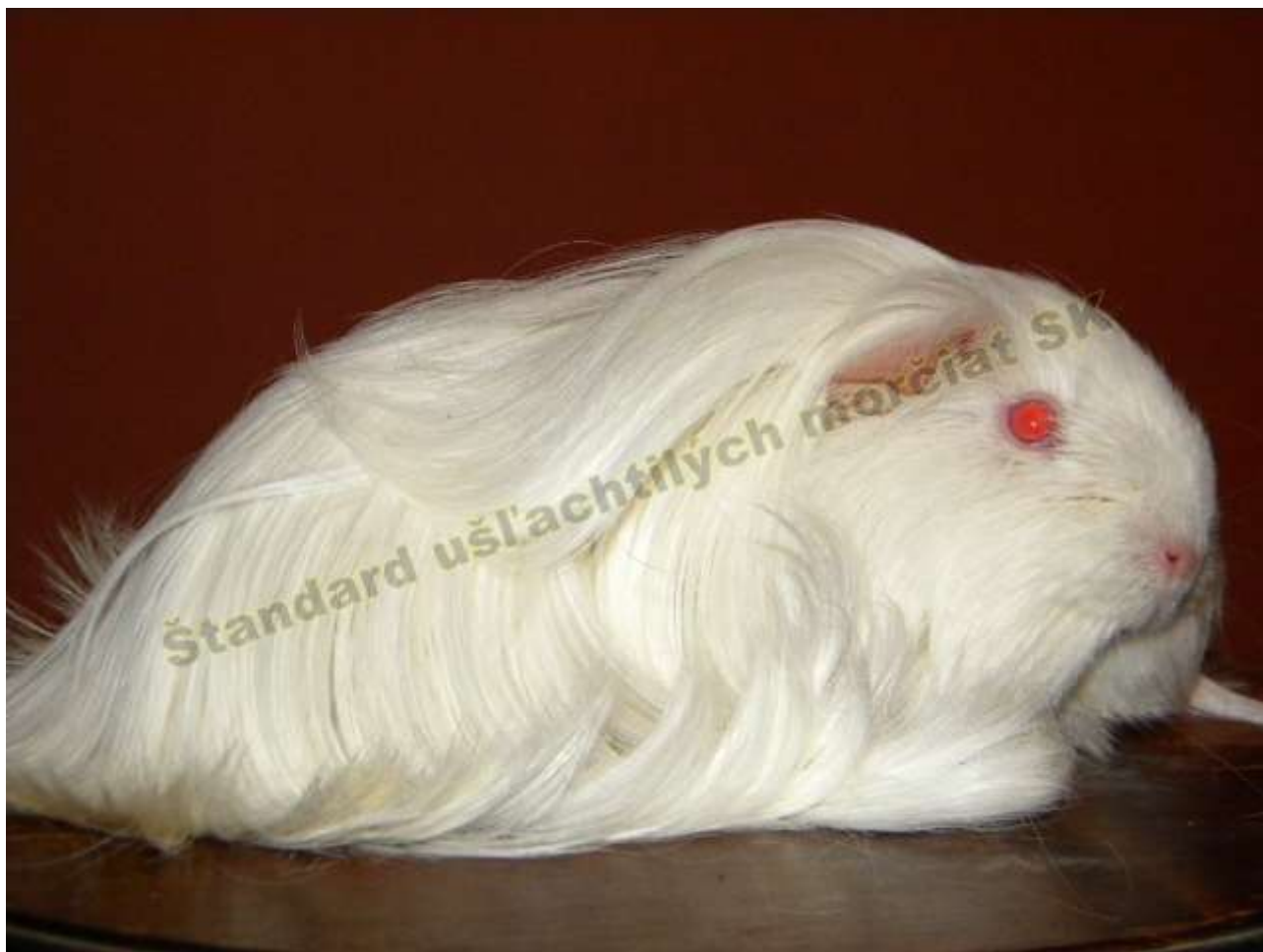
OBR. 5 BIELA ČERVENOOKÁ