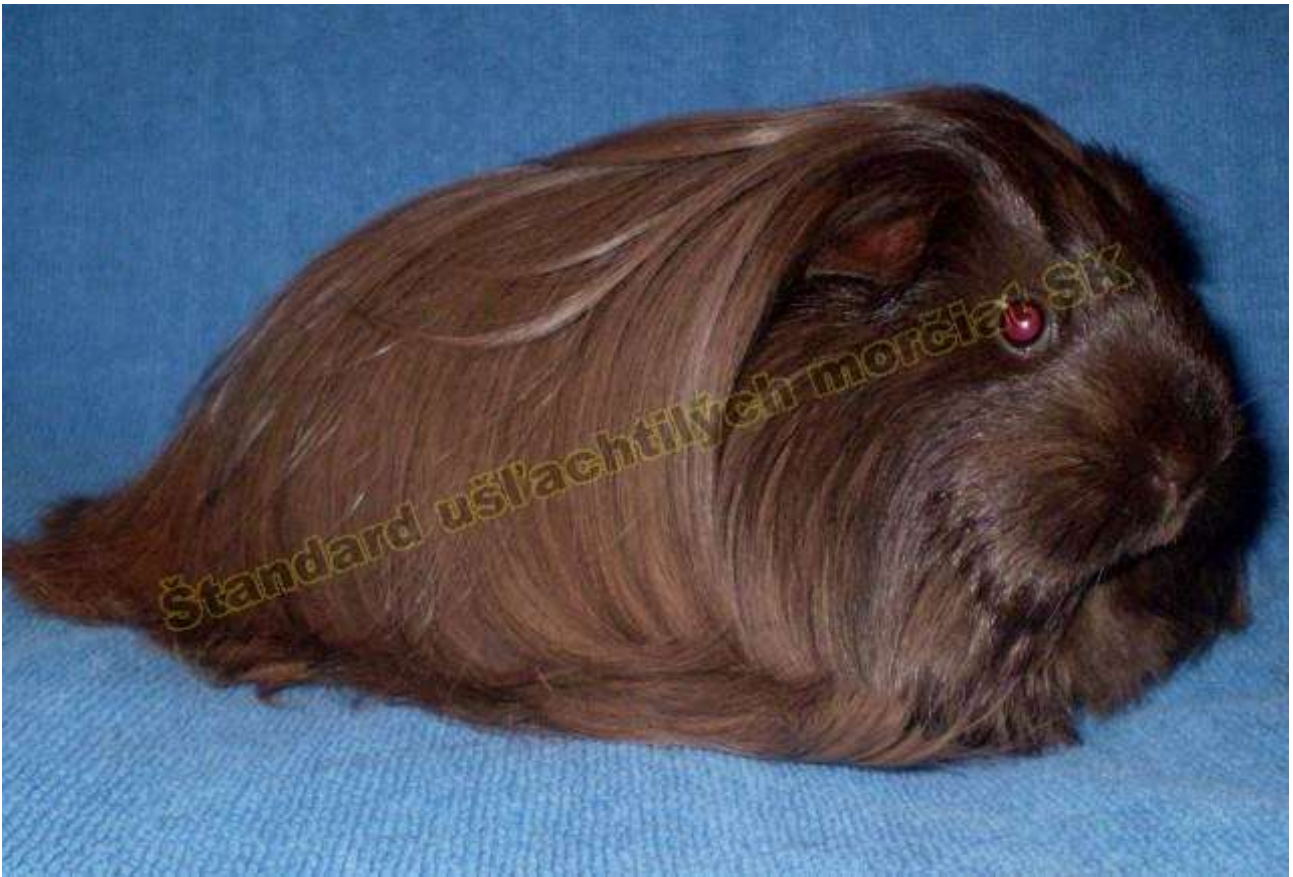
OBR. 2 ČOKOLÁDOVÁ