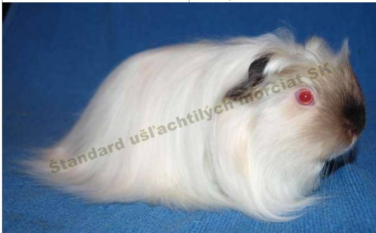
OBR. 6 HIMALAJA