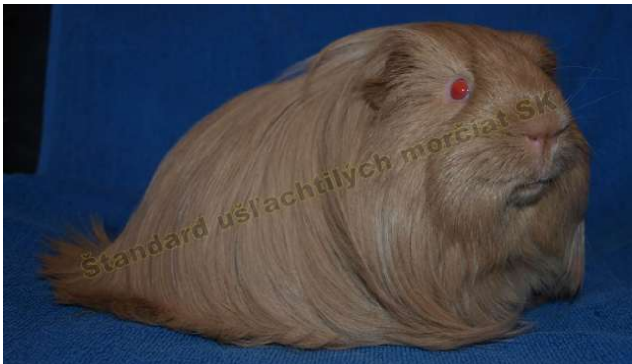
OBR. 3 BÉŽOVÁ