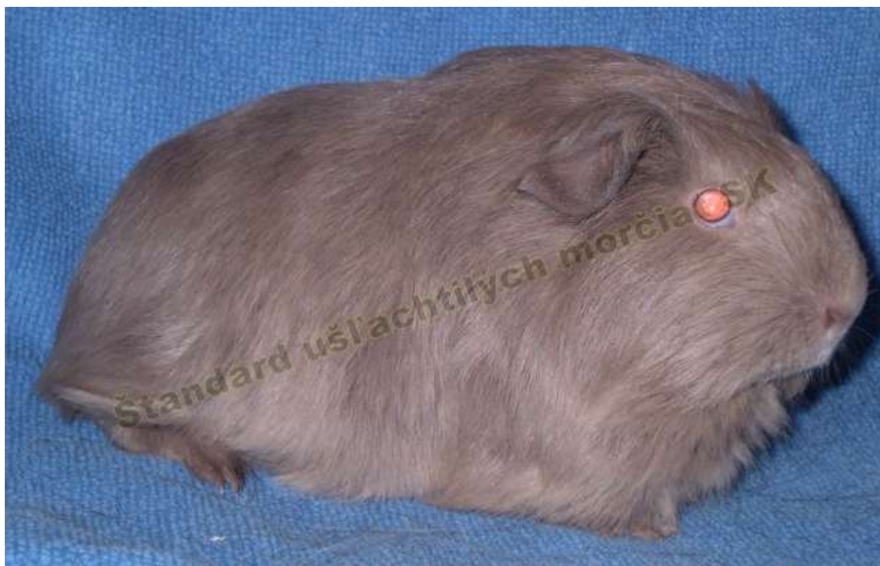
OBR. 1 SLATE BLUE